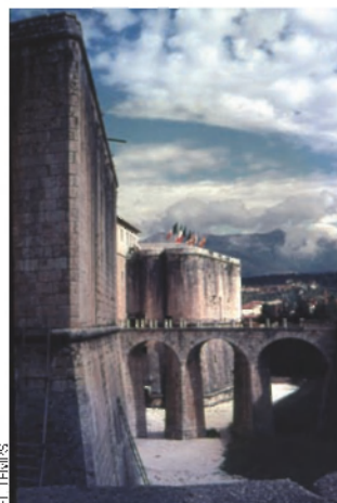
Castell de la Rocca.

Un altre emblema de L'Aquila, l'imponent i majestuós castell de la Rocca, no va aguantar les sacades de la natura desfermada. Moltes estructures internes s'han enfonsat. I, amb la notícia, els mitjans han estès la boira de la desinformació i la invisibilització. Resulta que el danyat és el “fuerte espanol”. Un fuerte espanol ? Un miracle! No, i ca, si és del segle XVII! Ah, ja és clar: és un castell, imponent,