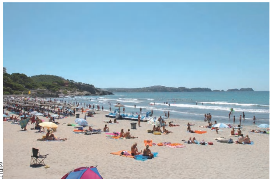
Cala Fornells, a Mallorca. Una de les sortides per a revifar el model de creixement de l'Euram que proposen els experts és el turisme de valor afegit que fugi dels tòpics de sol i platja.

Més R+D en l'àmbit públic i privat. A més d'adaptar el sistema educatiu a les noves necessitats productives de l'economia, el paper de les administracions públiques i també de