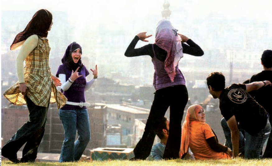
Anualment, la població egípcia creix d'un milió d'habitants. Cada any, 700.000 joves entren al mercat laboral.

Després de quasi trenta anys de govern de Husni Mubarak, el Caire dubta de la seua missió: el país ja no és cap model per al món àrab. A més, la successió a la presidència és oberta i Washington encoratja els seus grans aliats.