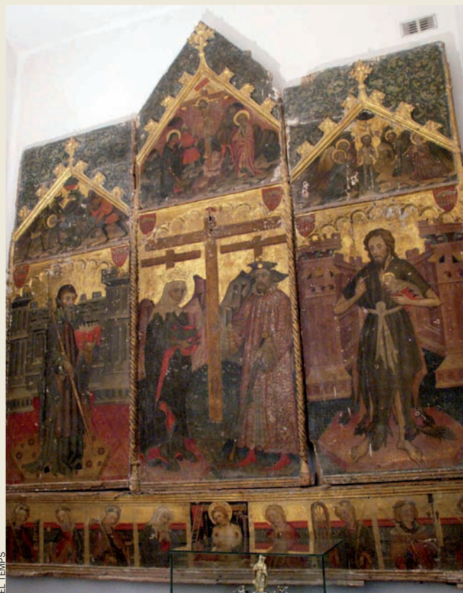
El retaule de Santa Elena, de Jaume Ferrer, de l'església parroquial de Benavarri.