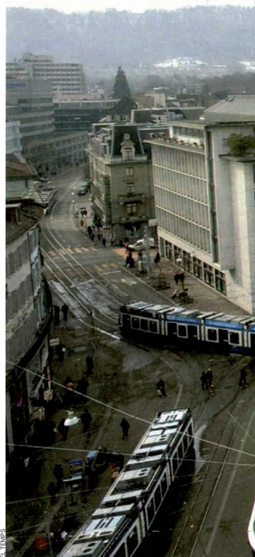
La plaça dels bancs a Zuric. Els guardians dels

En l'eterna lluita entre ministres de Finances i evasors d'impostos el to ha esdevingut ben aspre. Mentre el sector d'inversió de capital troba sempre noves idees per a assegurar els béns dels seus clients davant la intervenció del fisc, els governs avancen més vehemements que mai contra els paradisos fiscals, tal com es va posar de manifest a la reunió del G20 a Londres. Precisament la crisi financera global ofereix, per primera vegada en molts anys, l'oportunitat de restringir l'evasió fiscal a escala mundial.