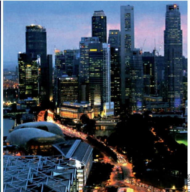
Paradisos financers a les illes Turks i Caicos i a Singapur: sempre hi ha noves possibilitats de frau.

Així doncs, ciutadans i empreses que fan negocis amb paradisos fiscals indesitjables hauran de lliurar a l'administració un informe ben detallat. En el futur, en aquests casos, el fisc podrà reclamar declaracions jurades als subjectes a impostos, i podrà demanar informacions als bancs estrangers. Qui s'hi negue, haurà de conformar-se amb penalitzacions fiscals.