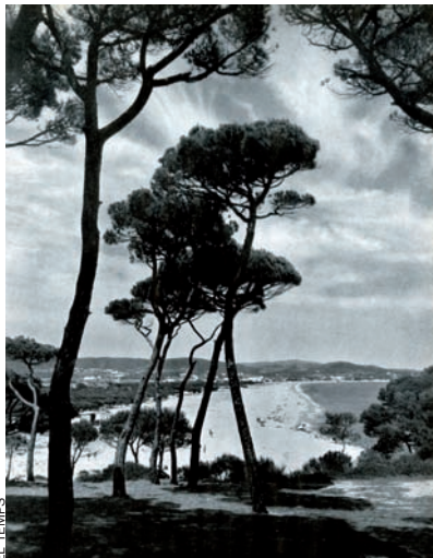
La Platja d'Aro, la platja més gran de la Costa Brava, els anys 50, quan comença a rebre turistes. Anunci de l'hotel Cliper, del 1958, quan encara no s'havia asfaltat ni urbanitzat el carrer principal de la població, la carretera de Sant Feliu a Palamós.

Cal créixer de cop: autoritzem gratacels a primera línia de mar. Cal assegurar l'estabilitat del visitant i no dependre dels tour operadors: prohibim la construcció de més hotels i afavorim la d'apartaments. Com ho podia fer, això, un ajuntament? Amb enginy: van dictar una disposició que obligava tot hotel