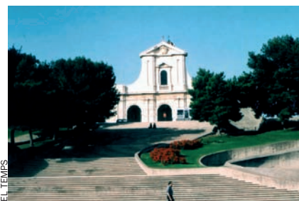
Santuari de la Mare de Déu de Bonaire.

Quan el 1324 l'infant Alfons, futur rei Benigne, assetjà Càller, envoltada per malsans aiguamolls salobres, els va evitar acampant en un pujol; el fortificà,