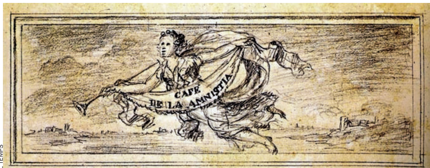
Els cafès eren locals polititzats, i ho indicaven amb el cartell. El de l'Amnistia era al número 1 del carrer Nou de la Rambla. L'amnistia es demanava per als liberals detinguts o desterrats.

circulaven fulls i impresos patriòtics que pretenien encendre els ànims de l'invasor.