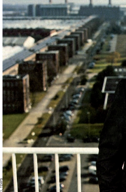
El cap de Volkswagen, Winterkorn: "Ningú no sap ben bé què ens espera."

notem una clara empenta. I aquesta és la qüestió. Cada dia, unes 2.000 persones demanen un Volkswagen a Alemanya. Al febrer foren 6.000. Els comerciants fan hores extra el dissabte fins a les 22 h. En consonància amb l'entrada de comandes, aquest serà el millor febrer de molts anys.