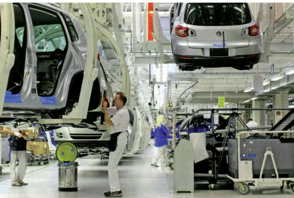
Producció del Volkswagen Tiguan a Wolfsburg: "Ara per ara ningú no pensa en acomiadaments."

dicar-vos a l'altra part de la vostra passió: construir cotxes esportius com l'Audi A8?