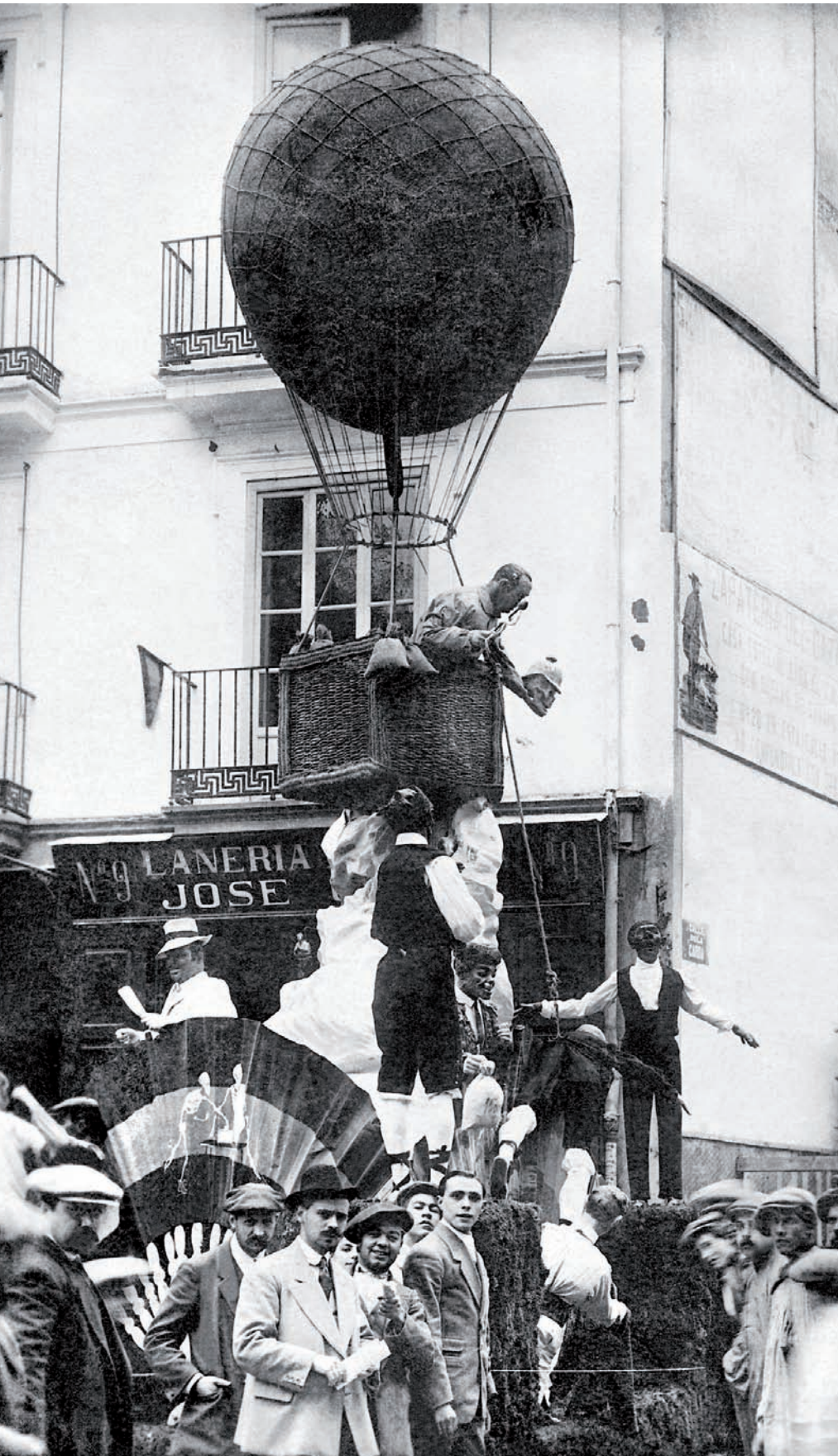
Un grup d'homes miren a la càmera mentre l'objectiu capta el monument Subsistències , a la plaça del Guerriller Romeu - Carda - Bosseria, 1916.