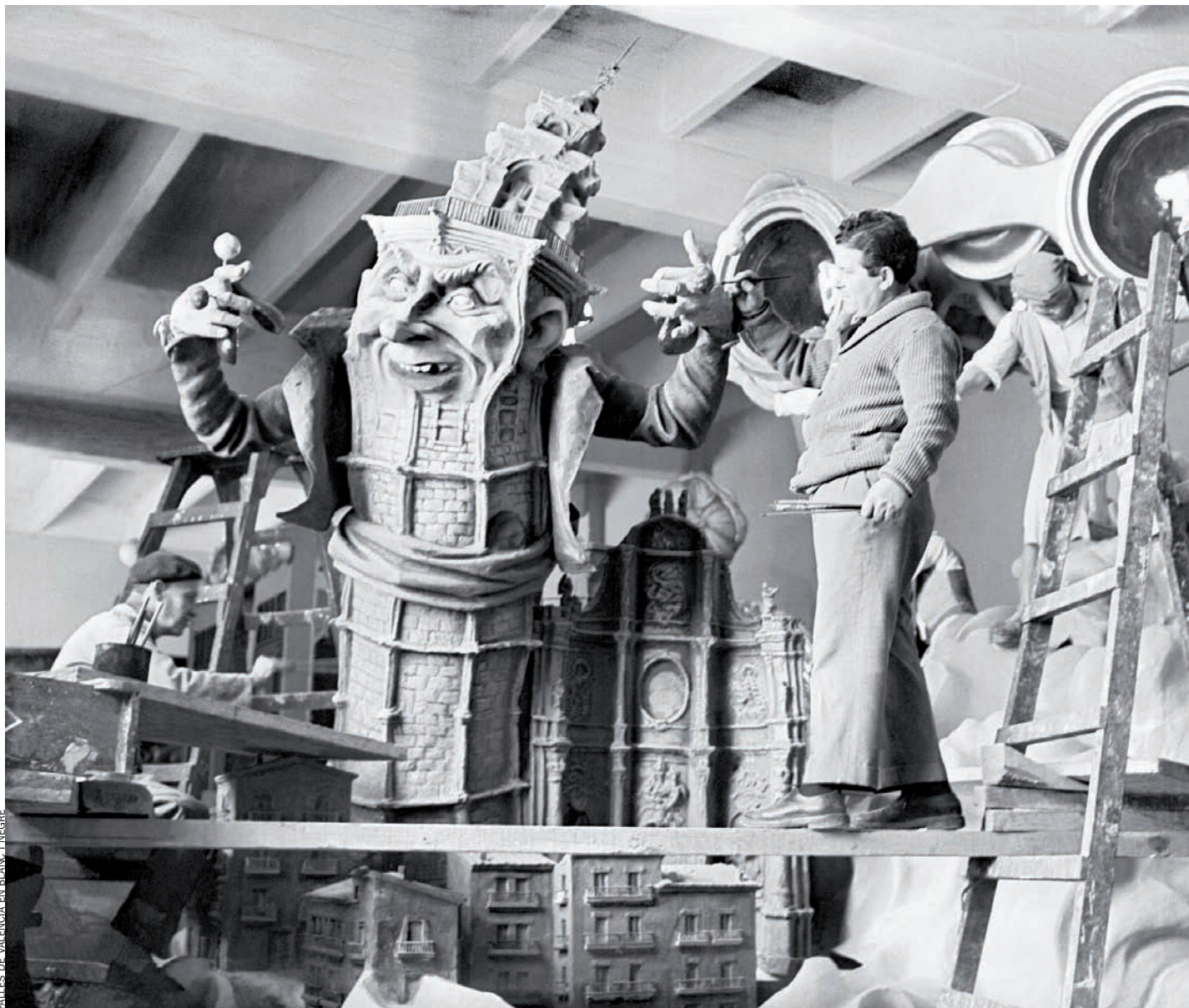
FALLES DE VALÈNCIA EN BLANC I NEGRE