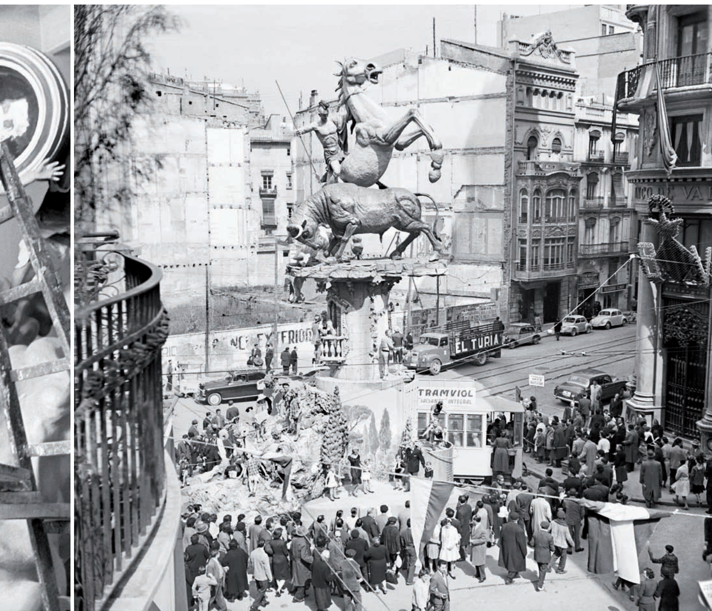
Les falles guanyaven monumentalitat. En aquesta imatge, la falla La cortesia de Barques-Pasqual i Genís, de l'any 1959.

La publicació d'aquest catàleg fotogràfic no és anecdòtica. Les falles, sovint abordades amb visions tòpiques i folkloritzants, han esdevingut d'un temps ençà un tema d'investigació al qual historiadors i sociòlegs s'aproximen amb una perspectiva científica i rigorosa. Fou precursor d'aquesta línia el pedagog i historiador —a més de signant de les Normes de Castelló— Enric Soler i Godes. Molts anys després, la publicació de Historia de las Fallas , al periòdic Levante-EMV , va reactivar l'estudi al voltant de la festa. Aquella obra, que va veure la llum el 1990 i que va coordinar el professor universitari