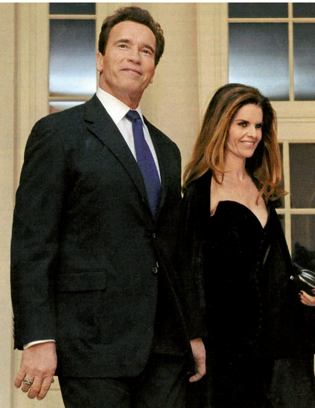
Matrimoni Schwarzenegger: "Un home normal no pot governar aquest estat."

Califòrnia és el laboratori on Amèrica es reinventa. Però ara aquest estat està ben estancat en la crisi. Arnold Schwarzenegger elogia el president Obama i troba els adversaris més durs dins el seu partit.