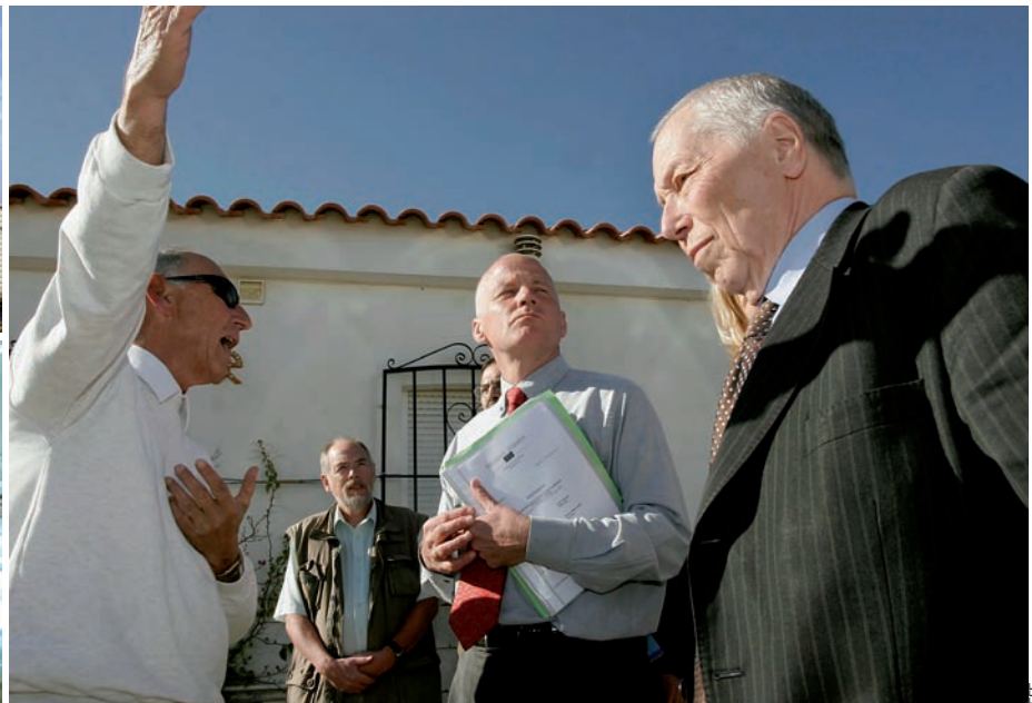
La manipulació de la ràdio i la televisió públiques valencianes no és denunciada eficaçment per l'oposició, a qui Canal 9 fa molt de mal. A sota, una sala de reunions de l'hospital de la Ribera, la gestió privada del qual ja no és tan mal vista pel PSPV-PSOE, i una de les visites urbanístiques dels eurodiputats.

ments, qüestionen algunes polítiques antitransvasistes i no parlen gaire dels possibles casos de corrupció del rival: menjar-se una part del pastís de vot del PP implica donar suport a una part de la política defensada pels populars. El procés d'aconseguir aquest objectiu, si mai l'aconsegueixen, serà molt i molt lent. Més que una crítica de baixa intensitat, però, cal una crítica constructiva. El PSPV encara busca el punt d'inflexió que l'enlaire electoralment." Poveda troba que "la tendència actual mena a un bipartidisme a les Corts, el 2011."