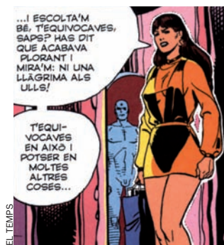
ESPECTRE DE SEDA II

És l'home del carrer, un antic fan de l'Au Nocturna original que en pren el relleu quan l'altre se sent gran i cansat. Ell també deixa, després, vestits i invents (una mena de nau voladora amb ulls de mussol n'és un de característic) per imperatiu legal i amb certa recança (Rorschach, amb qui havia fet tàndem, li'n farà retret en una escena memorable). Acaba embolicat amb Espectre de Seda II quan ella planta el Dr. Manhattan.