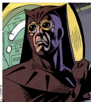
AU NOCTURNA II

Pren el nom i la màscara amb taques de tinta del famós test psicològic. Una infantesa difícil, una personalitat cada vegada més paranoide, una veu "horrible i monòtona", un fàstic declarat per la ciutat i la gent que hi viu defineixen, entre més trets, un personatge que es mira el món en termes de blanc o negre. Com un detectiu en decadència, vesteix barret i gavadina tronada. Llegeix amb fruïció el diari ultradretà New Frontiersman .