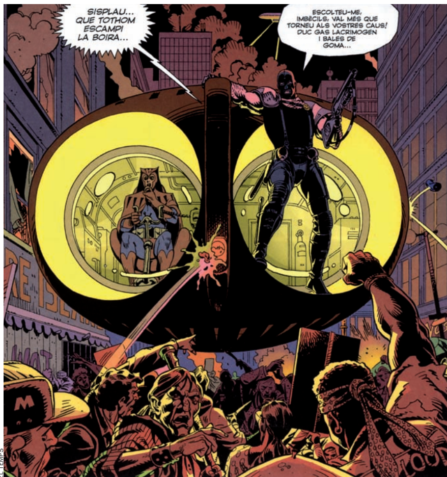
Dos dels watchmen , Au Nocturna II i el Comediant, poc abans de dissoldre a la seva expeditiva manera una manifestació.

El 6 de març s'estrena la versió cinematogràfica de 'Watchmen', un còmic que va trasbalsar el gènere ara fa vint anys i que ha esdevingut matèria de culte per a afeccionats i nouvinguts al món de la historieta gràfica. Qui sap si el film complirà expectatives, però de segur que serà, si més no, una bona excusa per a rellegir l'original.