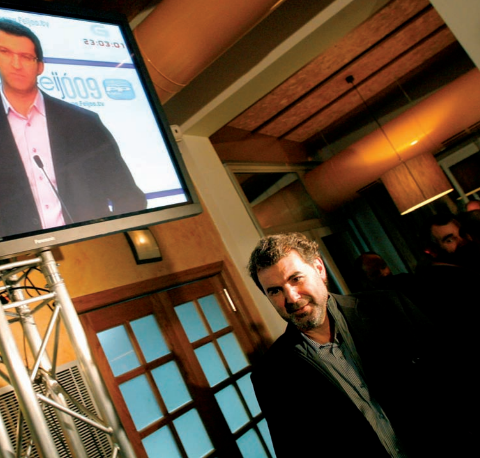
El líder del BNG, Anxo Quintana, passa per sota d'una pantalla en el moment que el candidat del PP, Alberto Núñez Feijóo, fa el seu discurs.

del 2005 encara han minvat més. Ara que el líder tenia les regnes d'un partit sempre convuls, ara que acabava de fer-ne cinquanta, segurament haurà de cedir el testimoni.