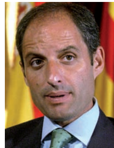
FRANCISCO CAMPS President de la Generalitat Valenciana