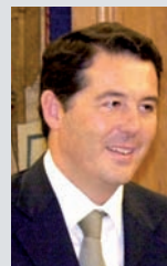
J. M. MICHAVILA Ex-ministre de Justícia, diputat al Congrés