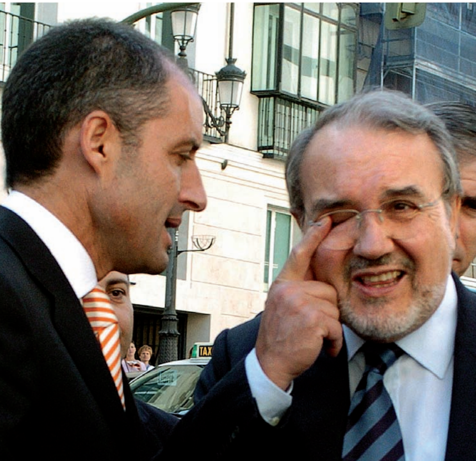
Francisco Camps, president de la Generalitat Valenciana, i Pedro Solbes, ministre d'Economia del govern espanyol.

El Partit Popular té raó de fer servir l'argument de la població. L'any 1999 al País Valencià hi vivien 4.066.474 persones; avui, 5.029.601. Les projeccions de l'institut d'estadística espanyol continuen apuntant cap a un augment, si bé no tan accelerat, amb vista al futur. L'Institut Valencià d'Investigacions Econòmiques, organisme dependent de la Generalitat Valenciana, ha calculat que, tenint en