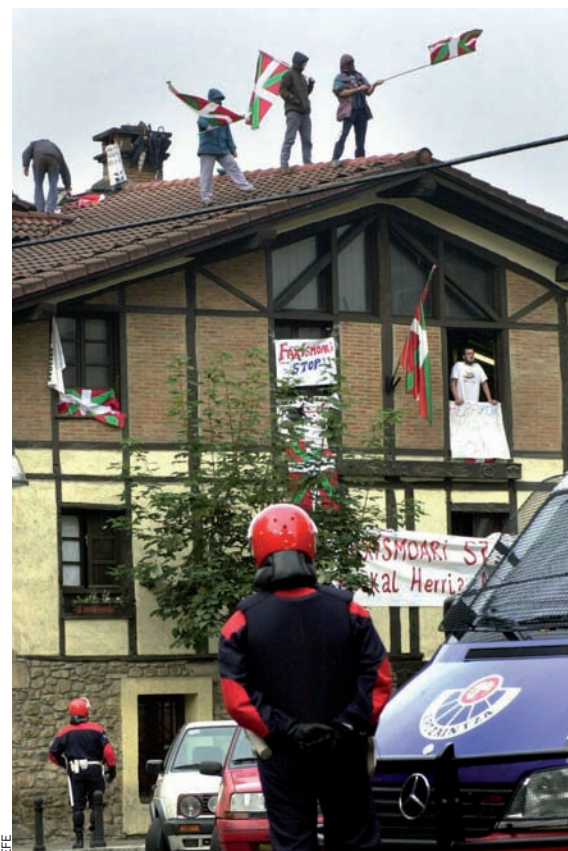
El 2002, una vintena de persones s'atrinxeraren contra l'Ertzaintza a l'herriko taberna de Durango.

Al centre del País Basc, Durango ha esdevingut un bon termòmetre per a saber què pensa l'anomenada esquerra 'abertzale' de l'atzucac en què és immersida. Dialoguem amb alguns simpatitzants i amb un regidor d'ANB.