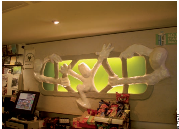
Tipi-Ttapa, local de Gestores Pro Amnistia, és un dels pols de reunió de l'esquerra abertzale a la vila. Els lluminosos diuen "amnistia" i "askatasuna".

d'estar callat, ha donat suport a l'estratègia repressora, i ara sembla dels nostres i tot! Encara enganyaran algú... Com amb allò de la consulta, que volien fer veure que són el que no són". Pel que fa a Aralar, neguen que siga "la pitjor opció", ja que "els seus orígens són els nostres".