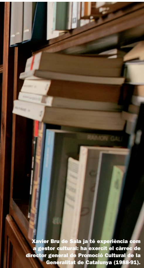
Xavier Bru de Sala ja té experiència com a gestor cultural: ha exercit el càrrec de director general de Promoció Cultural de la Generalitat de Catalunya (1988-91).