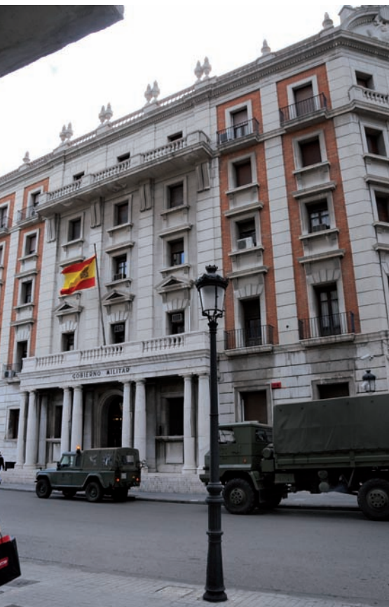
Els arxius de València van sortir de les dependències del govern militar.

postguerra: contra mestres o polítics, contra maquis o “suspectes” en general, la majoria d'aquests expedients van acabar en condemnes de presó, en penes de mort.