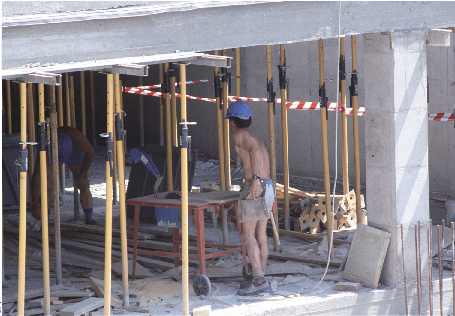
A Catalunya, el 34% de la població activa cobra entre 624 euros i 1.000 euros el mes, tot i que la Carta Social Europea recomana un SMI mileurista.

i el 51% de les dones ocupades— no es pot considerar ni tan sols mileurista. Segons dades de l'Agència Tributària, a les illes Balears, el 60,3% de la població activa és mileurista, exactament el mateix percentatge que al País Valencià. A Catalunya, el percentatge baixa fins al 50,1%.