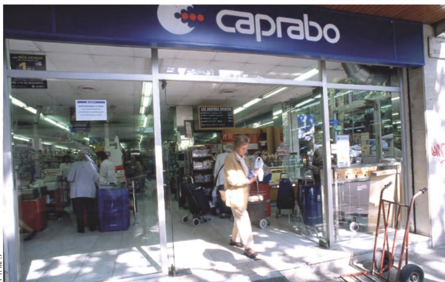
L'IPC ha quedat sobtadament reduït a prop d'un 1,5% als Països Catalans, si bé durant tot l'any superava el 4%. Els treballadors amb sous més baixos tenen un IPC real encara més alt.

La Carta Social Europea recomana que el salari mínim interprofessional (SMI) representi, almenys, el 60% del salari mitjà net d'un país. Si es complís aquest compromís internacional, signat per l'estat espanyol el 1961, l'SMI a casa nostra hauria d'atorgar a tots els treballadors la condició de mileuristes pel cap baix. La realitat, però, és que aquest sou mínim és de 624 euros mensuals, i que un 34% de la població activa de Catalunya —el 22% dels homes