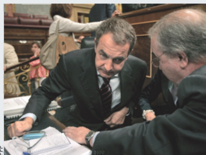
Brussel·les desmunta les previsions de l'estat.

La Comissió Europea preveu que l'economia espanyola es contraurà d'un 2% el 2009 i que continuarà retrocedint d'un 0,2% el 2010, després d'un creixement de l'1,2% de l'any passat. L'empitjorament de l'activitat econòmica farà que la taxa de desocupats pugi al 16,1% de la població activa enguany i al 18,7% el 2010, les xifres més altes de tota la Unió Europea i gairebé el doble que la mitjana comunitària. El panorama presentat a Brussel·les no ha estat ben encaixat pels responsables econòmics espanyols, que hi han tret importància i han exposat previsions força més optimistes.