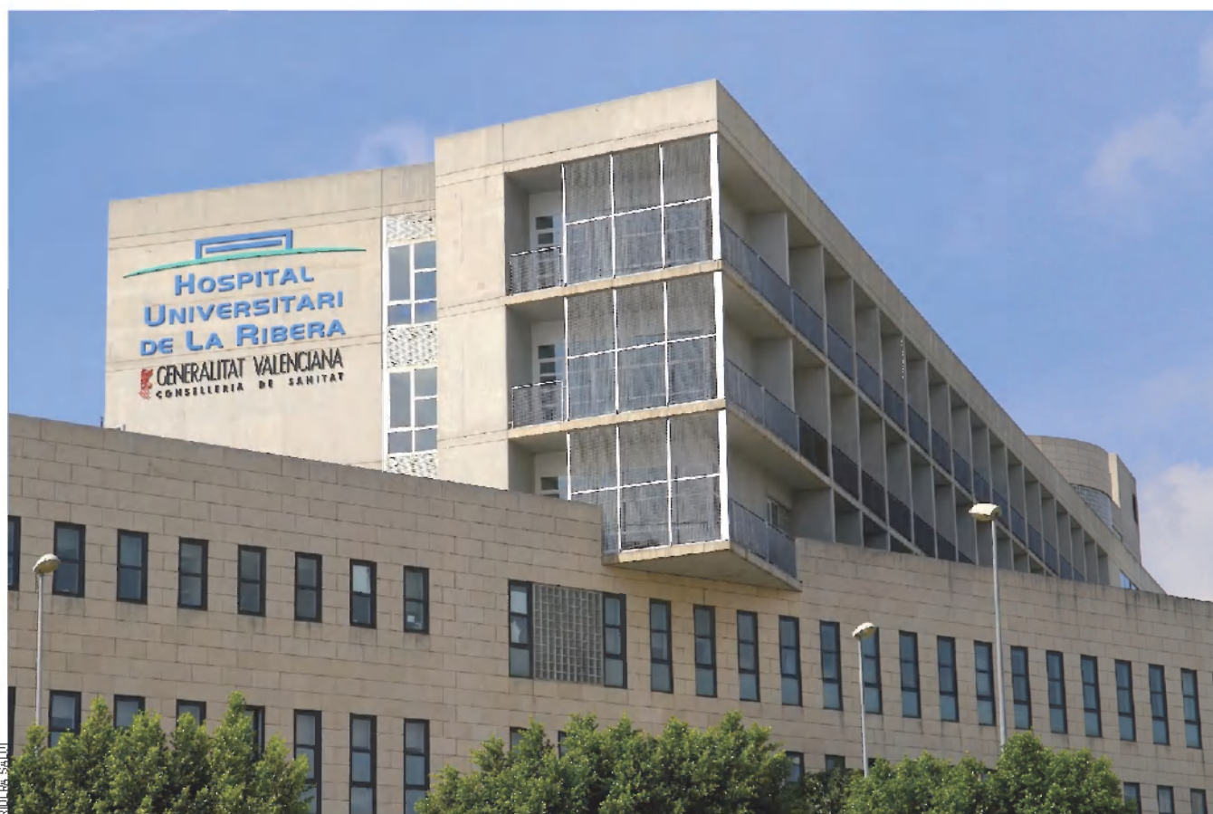
L'hospital de la Ribera, a Alzira, és gestionat per l'empresa Ribera Salud.