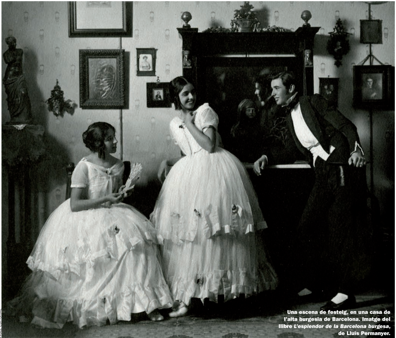
Una escena de festeig, en una casa de l'alta burgesia de Barcelona. Imatge del llibre L'esplendor de la Barcelona burgesa , de Lluís Permanyer.

La construcció del paradís terrenal iniciada per la burgesia catalana a partir de mitjan segle XIX i cristal·litzada a començament del XX ha estat refeta doblement, a través de dos volums d'Angle Editorial magníficament il·lustrats, perquè sense les imatges no es podria descriure prou bé aquell paradís.