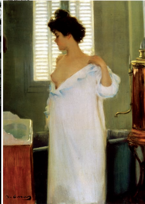
Bany principal del Palau del baró de Quadras (fotografia d'Adolf Mas feta el 1907 que apareix al llibre de Lluís Permanyer i al de Teresa-M. Sala). La moderna cambra de bany va servir a Ramon Casas per a fer ressaltar la bellesa femenina: Abans del bany , oli del 1894.

Forma part, com diu Xavier Puja-des a la Nadala 2008 de la Fundació Lluís Carulla, dedicada a L'esport a Catalunya , de la modernització del lleure. I així com l'art decoratiu havia d'embellir les noves cases dels burgesos, l'art pictòric del cartellisme havia de reforçar el glamour de l'esport.