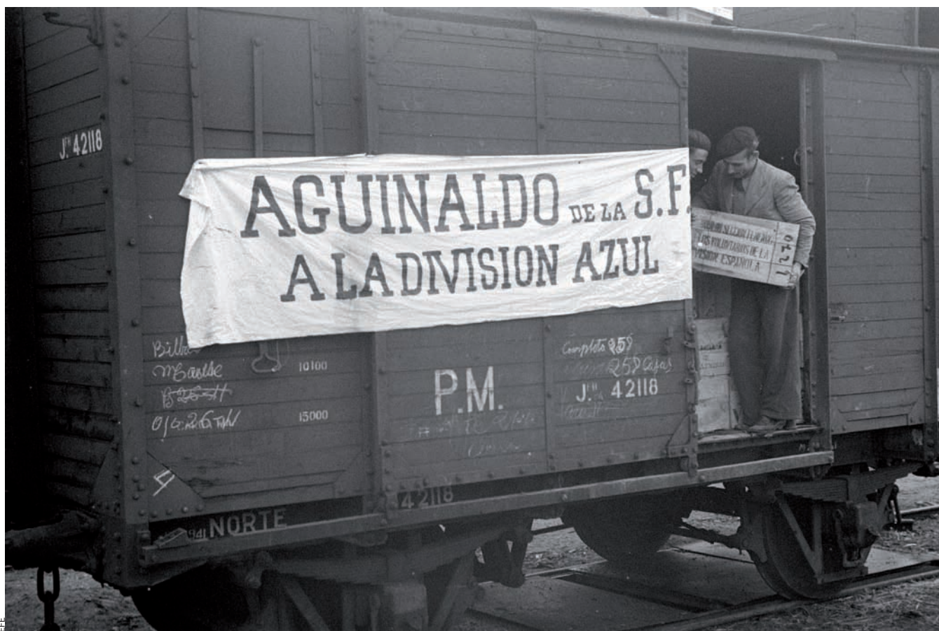
Tren noliejat per la secció femenina que va servir per a dur les estrenes de Nadal als voluntaris de la División Azul.

primera selecció de candidats l'havia de fer el Ministeri de Treball espanyol i la delegació de sindicats. Després els treballadors seleccionats —o productors , com els batejà la propaganda del règim— havien d'ésser avaluats per una comissió hispano-alemanya, havien de passar un reconeixement mèdic i, finalment, serien contractats. Per agilitar el procés es va crear una comissió que depenia del Ministeri d'Afers Estrangers espanyol, encapçalat per Serrano Suñer. El 1941 el règim va començar una campanya de propaganda perquè els treballadors s'apuntaren a les ofertes de treball a Alemanya. Segons consta als arxius del Ministeri d'Afers Estrangers, des del País Valencià van eixir dues expedicions: el 19 de maig del 1942, 465 treballadors provinents de Castelló i València, principalment; i el 18 de juny del mateix any, 442 treballadors que eren sobretot d'Alacant, Castelló i València. En total, 650 treballadors van deixar el País Valencià per anar a treballar a les fàbriques o als camps de conreu alemanys. El 1943 només van