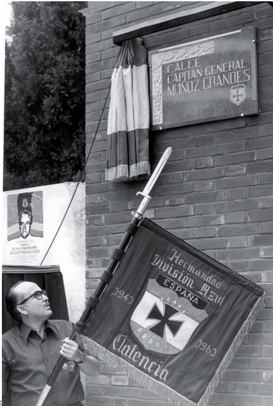
Inauguració, a València, d'un carrer dedicat a Muñoz Grandes, cap de la División Azul, amb presència de divisionaris valencians.

vivia a la ciutat de València, i era espia i representant del Ministeri d'Alimentació alemany.