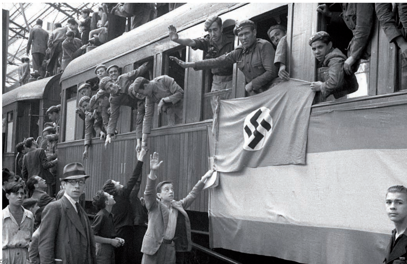
Arribada del contingent de la División Azul a l'estació del Nord de València.

L'empremta alemanya al País Valencià, abans de la Guerra Civil Espanyola i després, va ser subtil però ferma. Fins al punt que quan els vents de la postguerra europea van girar cap als aliats, els valencians oblidaren les relacions tan especials que durant anys havien tingut amb els camarades alemanys. La ciutat de València va ser l'escenari de tota mena d'adhesions i de transgressions amb la creu gammada com a teló de fons: voluntaris valencians van anar a lluitar contra la Unió Soviètica amb l'anomenada División Azul, hi hagué sabotatges contra l'exportació de fruita cap a països aliats durant la Segona Guerra Mundial, la Gestapo va enganyar un sacerdot austríac que feia classes a València per fer-li passar la frontera amb França, on el va segrestar, i milers de valencians van anar a treballar a les fàbriques alemanyes. Tot això va passar en una ciutat que el 1939 s'havia despertat amb unes simpaties clarament germanòfiles i que el 1945 només volia la pau i oblidar la Segona Guerra Mundial.