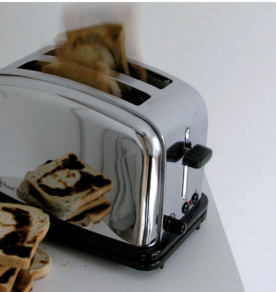
Mona Lisa toaster, 2007.

L'obra d'art ha patit una profunda transformació i és per això que necessita una revisió exhaustiva. I amb ella, el seu context. I amb tots dos, el paper del crític d'art.