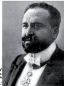
VICENT BLASCO IBÁÑEZ

(València, 1867 - Menton, Occitània, 1928)