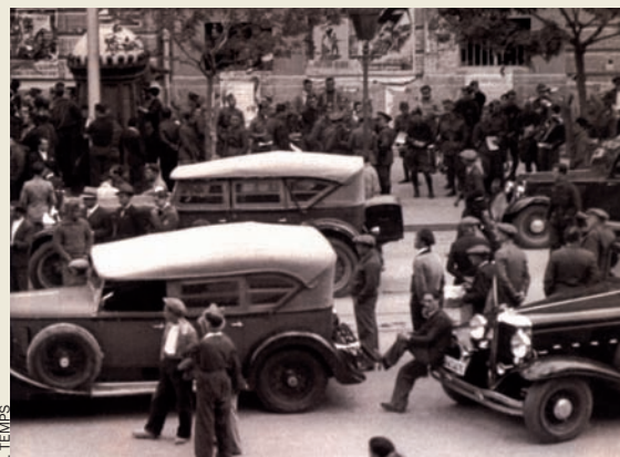
València, durant la guerra civil, fou lloc d'acollida també per als maçons.

València va ser només durant un any capital de la maçoneria. Fou el mateix temps que el govern republicà tardà a tornar-se a traslladar a un altre indret, Barcelona. Només tres setmanes després del trasllat, les estructures superiors del Gran Orient Espanyol passaren a la capital catalana. Alguns maçons s'incorporaren a les lògies catalanes ja existents. Molts altres abandonaren l'activitat aclaparats per la duresa del dia a dia. Un mes després, feu això mateix la Gran Lògia Espanyola. Amb la derrota en la batalla de l'Ebre i la caiguda de Barcelona, als maçons només els va quedar la via de l'exili forçat.