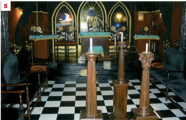
1 i 2. Façana de l'antic convent de Sant Agustí. 3. Façana del carrer de la Portaferrixa, 11. 4. Salutació maçònica, dins del triangle, a la cooperativa La Fraternitat, de la Barceloneta. 5. Gran Logia Simbòlica Espanyola, del carrer d'Avinyó. 6. Conjunt escultòric que presideix la façana dels Porxos d'en Xifré.

i el triangle d'una casa de la Portaferrixa, la del número 11, o l'edifici dels Porxos d'en Xifré, el del restaurant de la cantonada, les Set Portes, tan ben estudiat per Josep Maria Carandell.