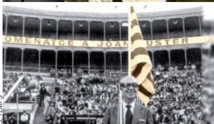
Selecció d’imatges del documental ‘Ser Joan Fuster’.

crídat a Berlín, a Josep Renau: ‘Renau, mira el que ha passat, has de vendre.’ Va ser realment espectacular.”