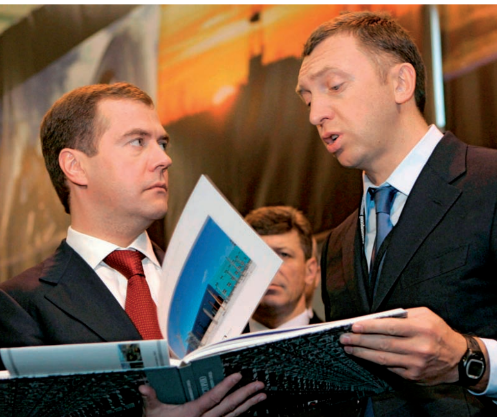
Oleg Deripaska, propietari de Basic Element, conversa amb el president de Rússia, Dmitri Medvedev, durant la visita que va fer a una de les seves empreses quan era candidat a la presidència, el febrer d'enguany.

acabar-ho d'adobar, arran d'aquesta compra, Deripaska encara ha de pagar a Onexim Group, propietat de Prokhorov, un total de 1.400 milions de dòlars. Segons la revista SmartMoney , és difícil que Deripaska pugui fer front a