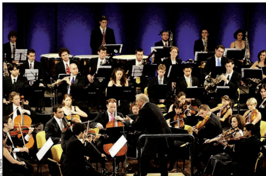
El director Barenboim amb la West-Eastern Divan Orchestra, a Ramallah, l'any 2005.

—També interpreteu Wagner amb la vostra West-Eastern Divan Orchestra, on toquen joves cristians, musulmans i jueus junts. Voleu fer avançar