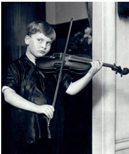
Nens prodigi: Barenboim (l'any 1950) i Menuhin (1924): maduresa sense experiència.

així el procés de pau del Pròxim Orient. No és una mica ingenu?