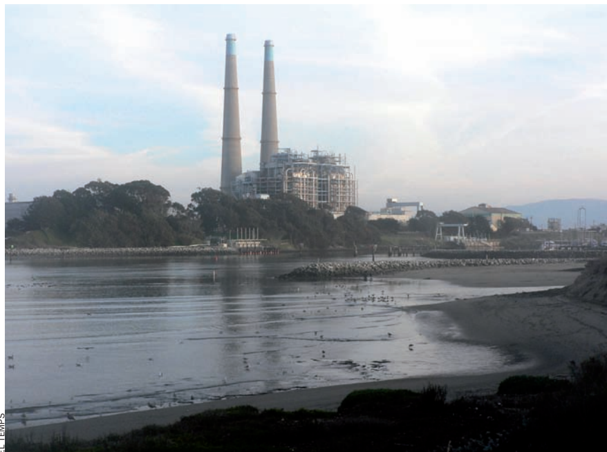
EL TEMPS Factoria de l'empresa Calera a Moss Landing, Califòrnia.

El noruec Olav Kårstad, un enginyer de l' StatoilHydro Group, ha ideat aquest procés. Va aplicar-lo per primera vegada en una plataforma de perforació de gas de la mar del Nord, on el diòxid de carboni es bomba al pou i se n'extreu un valuós gas natural alhora. Fins aleshores,