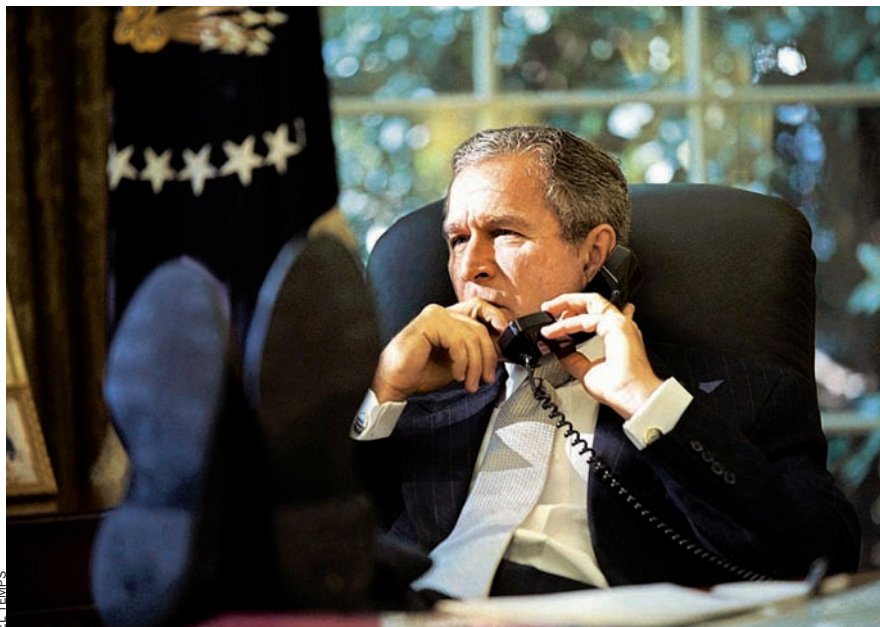
A dalt, George W. Bush fotografiat l'any 2001. A baix, l'actor Josh Brolin, que interpreta el paper del president al nou film d'Oliver Stone.