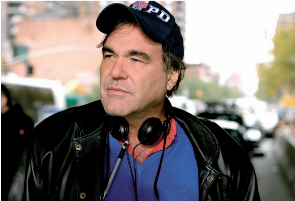
El director Oliver Stone durant el rodatge de W .