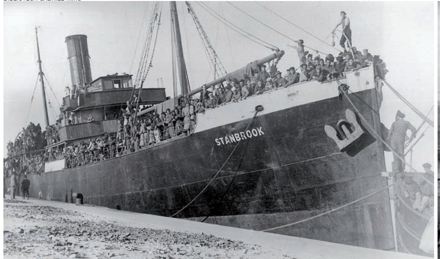
BIBLIOTECA GABRIEL MIRÓ

“ El tinent cridà els que havíem estat amb ell i es va despedir [...] dient-nos que estava molt orgullós de nosaltres. Després va dir que anàrem amb molta cura i pensàrem en les nostres famílies, que no férem res que donés pas a la represàlia dels feixistes i algunes coses més. I va treure la pistola i es pegà un tir. Va caure com si la terra el cridara i no soltà l'arma.”