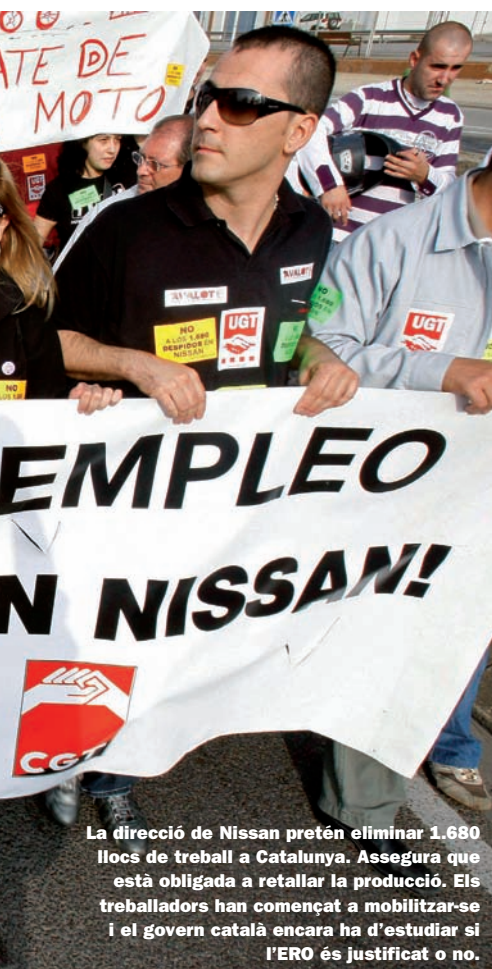
La direcció de Nissan pretén eliminar 1.680 llocs de treball a Catalunya. Assegura que està obligada a retallar la producció. Els treballadors han començat a mobilitzar-se i el govern català encara ha d'estudiar si l'ERO és justificat o no.