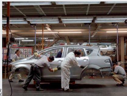
Interior de la fàbrica automobilística de Seat a Martorell.

Las caigudes dràstiques en la venda d'automòbils han obligat el govern espanyol a prendre mesures. Per tal d'injectar diners en aquest mercat, ha donat via lliure a les financeres de les marques automobilístiques perquè accedeixin al fons de 30.000 euros ampliable a 50.000, habilitat fa dues setmanes. Per accedir a aquest fons, les financeres de les companyies automobilístiques hauran d'estar registrats al Banc d'Espanya com a establiments financers de crèdit i hauran de titularitzar la cartera d'actius a través d'un banc. Entre les entitats que podran beneficiar-se'n hi