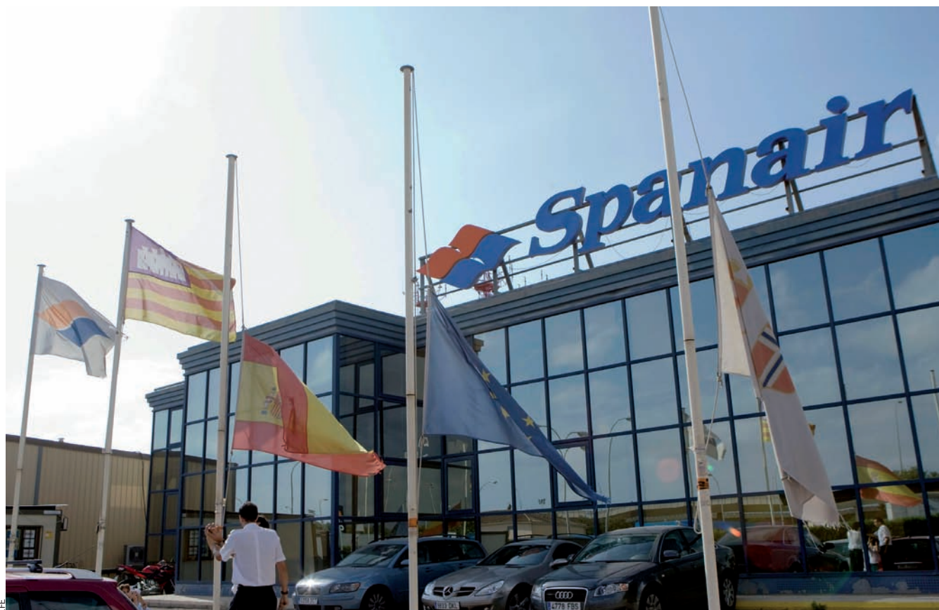
La companyia aèria Spanair, amb seu central a Palma, també es desfà de gairebé 1.200 treballadors amb un expedient de regulació d'ocupació.