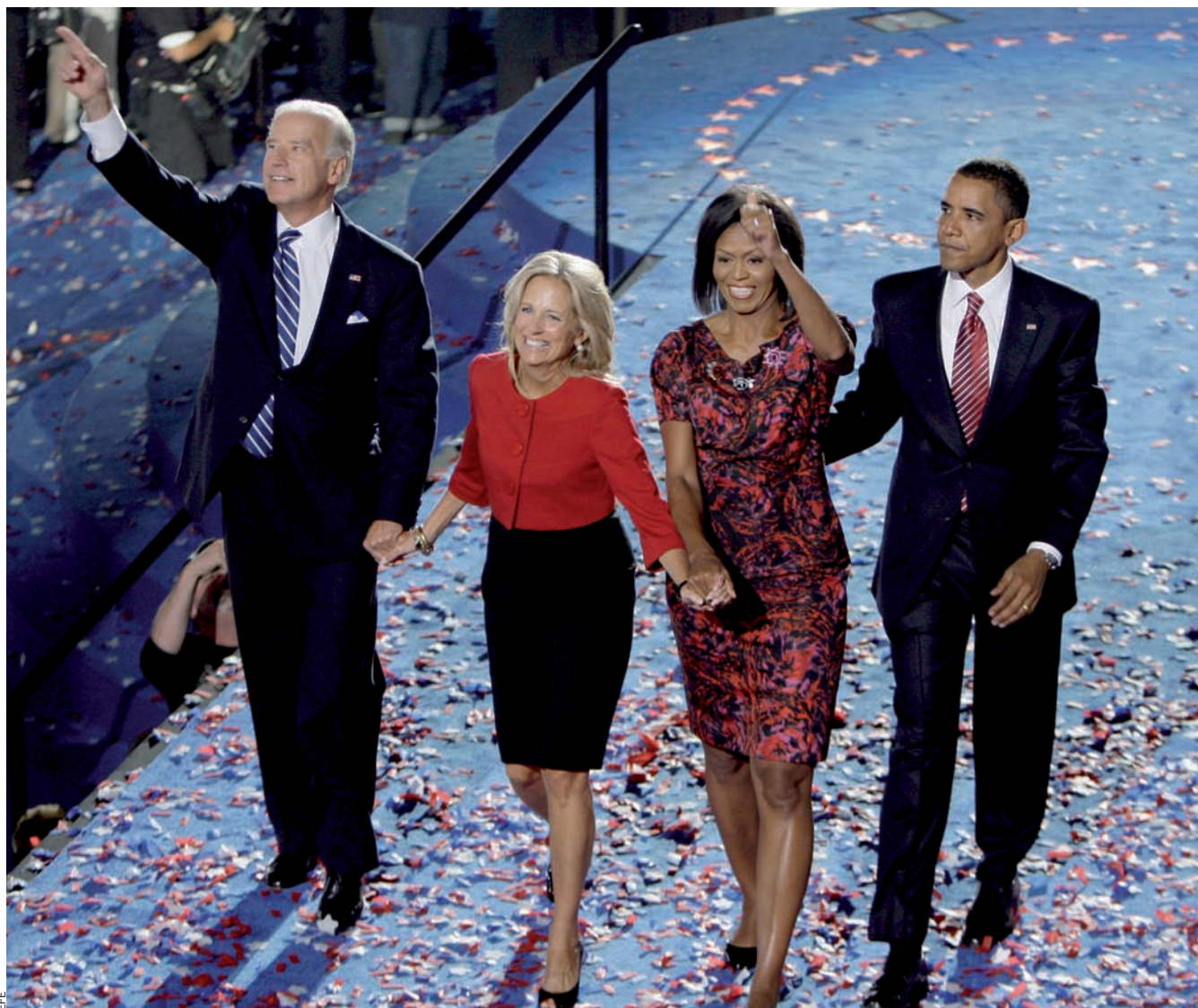
Barack Obama i Joe Biden, candidats demòcrates a la presidència i a la vice-presidència dels Estats Units, acompanyats de les seves esposes, saluden el públic durant un acte de la campanya electoral.