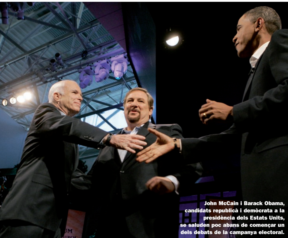
John McCain i Barack Obama, candidats republicà i demòcrata a la presidència dels Estats Units, se saluden poc abans de començar un dels debats de la campanya electoral.