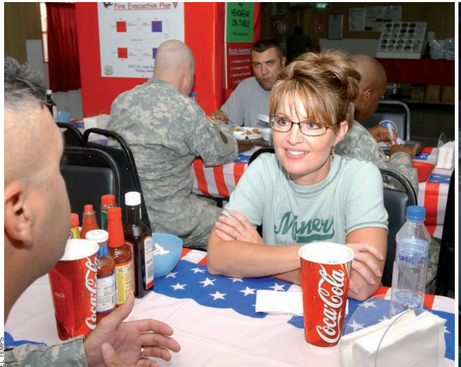
Sarah Palin, governadora d'Alaska i candidata republicana a la vice-presidència dels Estats Units, comparteix taula amb uns soldats de l'Alaska National Guard, durant una visita que va fer a Kuwait el juliol de l'any passat.

No a les armes nuclears. Curiosament, tot i aspirar a governar la potència nuclear més gran del món, els dos candidats a la presidència dels Estats Units coincideixen a proposar un món sense armes atòmiques. En aquest sentit, els programes de Ba-