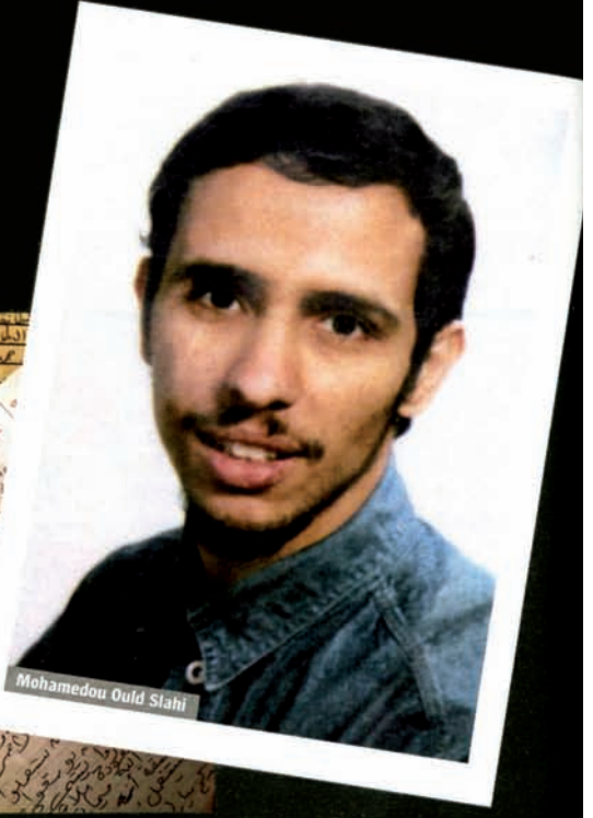
Mohamedou Ould Slahi