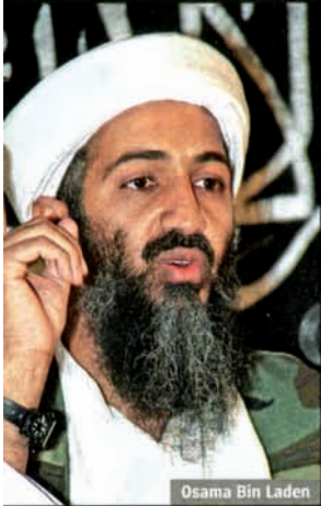
Osama Bin Laden

“No pateixis –va dir a la seva mare–. Torno de seguida.” Mai no va tornar.