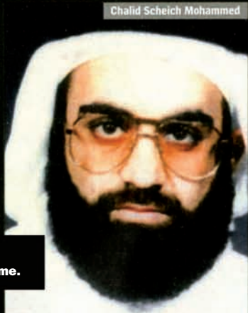
Khalid Scheich Mohammed