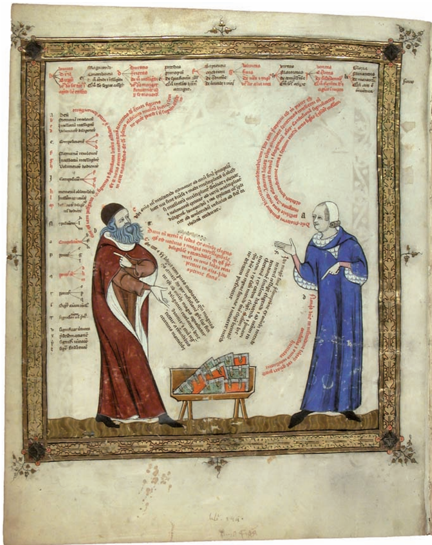
Llull i Thomas Le Myésier discutint sobre l'obra lul·liana. Miniatura del Breviculum , de Le Myésier.

A les exposicions que porta a terme a CaixaForum Palma, l'Obra Social "la Caixa" vol posar èmfasi en els aspectes de la cultura que han contribuït més a modelar la identitat col·lectiva de les Illes Balears.