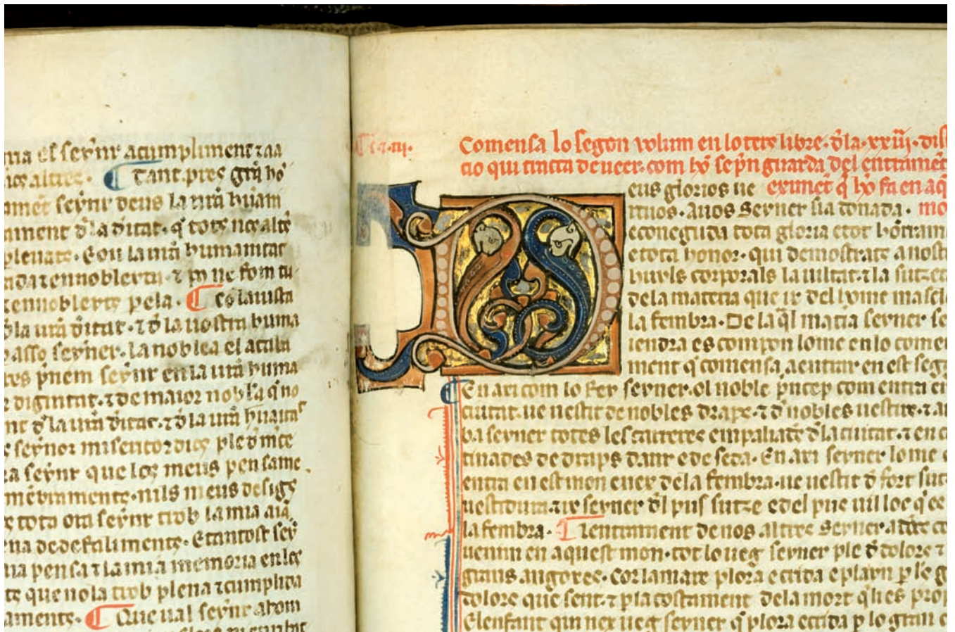
Llibre de contemplació en Déu, c. 1300. Manuscrit pergamí de la Biblioteca Diocesana de Mallorca.

una lluita personal contra Llull i els seus seguidors. L'obra exposada és de gran importància per l'antiguitat i perquè conté anotacions fetes per la mà del mateix inquisidor.