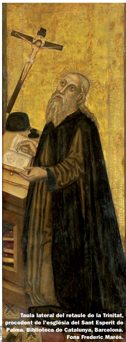
Taula lateral del retaule de la Trinitat, procedent de l'església del Sant Esperit de Palma. Biblioteca de Catalunya, Barcelona. Fons Frederic Marés.

Un moment de vital importància en la vida de Llull és la il·luminació a Randa (Andratx), quan té trenta anys. A partir d'aquest moment, se sotmet a un nou model de vida, dedicat a la contemplació. Pintures i escultures, com també fragments del seu Llibre de contemplació , ens permeten d'entendre aquest moment cabdal per a l'inici de la seva activitat missionera.