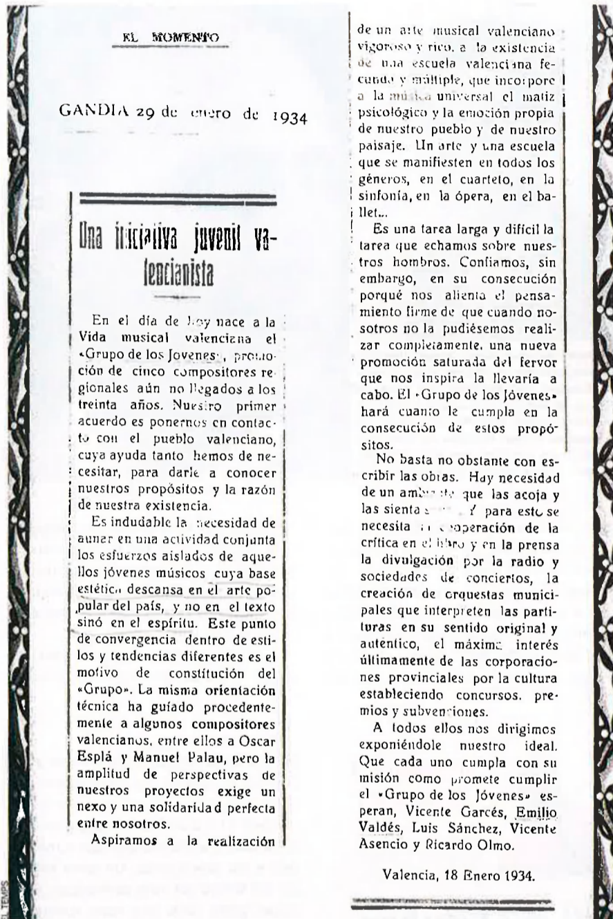
Pàgina d'El Momento de Gandia en la qual es reproduïa el manifest del Grup de Joves.

El projecte. Així doncs, la música nacional ha de beure de les fonts de la música popular, però no com a font de melodies directament utilitzades en les noves composicions, sinó com a pou en el qual hom pot trobar elements rítmics, modals i melòdics