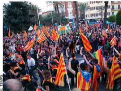
Manifestació del 9 d'Octubre.

la dels antics pobladors de cultura àrab. Una altra llengua –la dels valencians d'ara–, una altra cultura, una altra religió –lligada a l'eterna Roma– ocupaven i colonitzaven unes contrades que començaven a ser valencianes. Un canvi radical en les terres del Xarq al-Andalus: unes noves gentes amb una nova concepció del món generaven una nova personalitat en un vell solar, la valenciana, una nova forma de ser europeus. I el 9 d'octubre del 1238 van passar dues coses emblemàtiques: l'entrada triomfal del Conqueridor a la ciutat i la consagració de la Seu sota la presidència del monarca. No eren simples actes militars, religiosos o protocol·laris, sinó l'ostentació clara de l'acta de naixement d'un poble sobirà. I això fins al punt que, més tard, quan es redacten els Furs, són datats "en l'any de Nostre Senyor MCCXXXVIII, a nou dies a l'entrada del mes d'octubre". Hi ha, doncs, una clara voluntat d'escriure amb aquells fets la vera acta