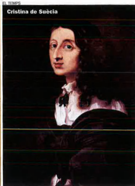
Cristina de Suècia