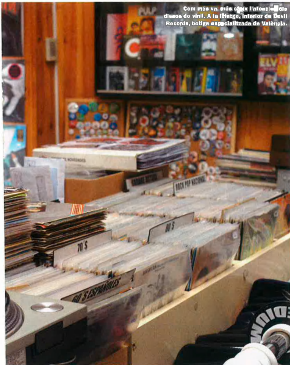
Com més va, més creix l'afició als discos de vinil. A la imatge, interior de Devil Records, botiga especialitzada de València.

Pearl Jam, que l'any 1995, quan el poder del CD ja era gairebé omnímode, havent arraconat vinils i sobretot cassets, publicaren exclusivament en plàstic el seu Vitalogy , del qual pogueren col·locar 35.000 còpies.