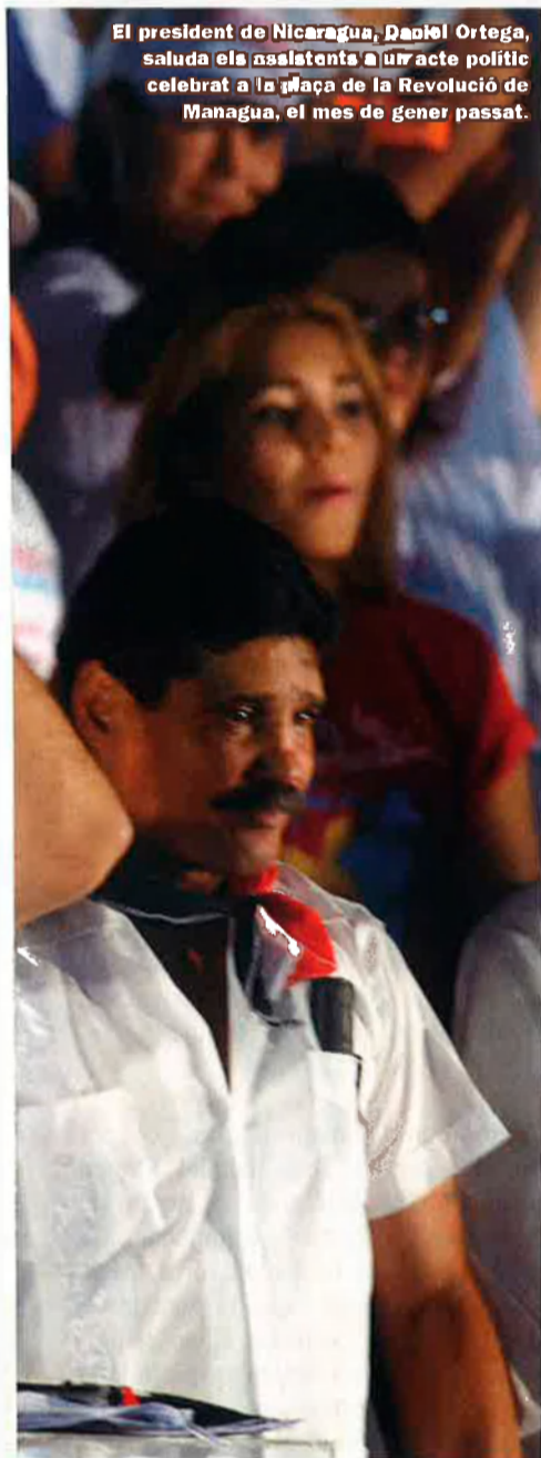
El president de Nicaragua, Daniel Ortega, saluda els assistents a un acte polític celebrat a la plaça de la Revolució de Managua, el mes de gener passat.

Quan feia pocs dies que la Comandante Dos –com era coneguda Dora María Téllez– havia fet cas dels metges i havia abandonat la vaga de fam, va aparèi-