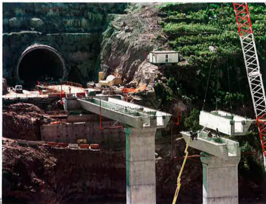
Catalunya acumula una llarga llista de déficits en infraestructures. La disposició addicional tercera de l'Estatut obliga l'estat a invertir-hi tant com la contribució de Catalunya al PIB espanyol.

Allò que els pertoca i el dels altres. A l'altre extrem hi ha els privilegiats que no únicament veuen executat el 100% del seu pressupost, sinó que encara reben més inversions extra que quedaven fora de la partida aprovada pel Congrés espanyol. És el cas, per exemple, d'Aragó, que el 2003 va rebre un 168% d'inversions en el capítol de Foment, és a dir, un 68% més del que estableixen els pressupostos generals de l'estat (PGE). El 2004 i el 2005, aquesta comunitat va rebre un 133% d'inversions, un percentatge que el 2006 va baixar al 87%, però que el 2007 es va tornar a enfilar fins al 124%, tal com consta a l'anuari estadístic del Ministeri de Foment i els informes econòmics i financers de l'executiu espanyol dels anys corresponents. La comunitat de Madrid també pateix de sobreinversió. Des del 2003, el capítol de Foment dels pressupostos executats per a aquest territori supera el 100%, igual com Extremadura i Cantàbria. En el cas del País Basc i Navarra, que es regeixen pel sistema foral, les inversions estatals i els percentatges d'execució són molt menors. A Galícia, durant els anys de govern PP a Madrid, les inversions en el capítol de