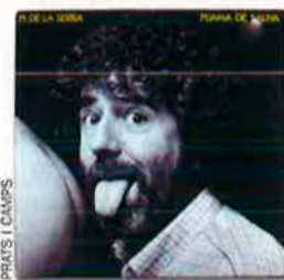
'Pijama de saliva', de Pi de la Serra. Edigsa, 1982. Disseny i fotografia són de Quim Boix i Josep Casanova / Estudi BCN. Expressivitat i transgressió divertida es combinen en una imatge que expressa més que un estat d'ànim, a començament dels 80.

moderna i en català". Els Setze Jutges compareixien a escena i ho feien gràcies a la jove editora (creada, recorda Gàmez, per "un petit accionariat provinent de les anomenades classes liberals catalanes i alguns empresaris catalanistes") i tot cercant conjuntament "uns senyals d'identitat propis dins un concepte de modernitat i avantguarda que el diferenciarà clarament de la resta de les cases discogràfiques que hi havia en aquell moment".