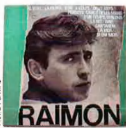
'Raimon'. Edigsa, 1964. El primer LP de Raimon mostra la revolució Edigsa: combina l'expressivitat de la fotografia en blanc i negre (obra d'Oriol Maspons) amb l'audàcia compositiva de Jordi Fornas, que n'és el dissenyador.