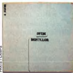
'A Alcol', d'Ovidi Montllor. 1974. Un àlbum-objecte que va trencar motlles: amb disseny i concepte d'un altre alcolà, Antoni Miró, s'utilitza el cartó-caixa (amb un material i una escenificació volgudament pobres) per acostar-se a la realitat popular que vol retratar.