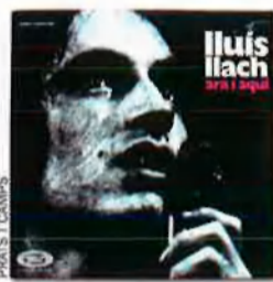
'Ara i aquí', de Lluís Llach. Movieplay, 1970. La nova discogràfica llença la casa per la finestra per a acollir el cantant de Verges: un luxós àlbum en directe d'estètica pop i dissenyat per Munil i Vilanova que té un aspecte cridaner per a l'època.