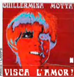
'Visca l'Amor!', de Guillermina Motta. Concèntric, 1968. La coberta glamorosa i pop, tot seguint l'onada que marquen el Sgt. Pepper's dels Beatles i la banana warholiana, és obra del dibuixant de còmic Enric Sió.