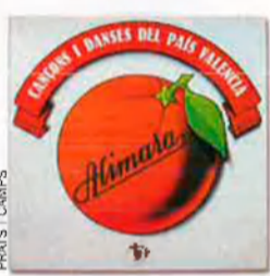
'Cançons i danses del País Valencià', d'Alimara. Pu-Put, 1978. El dissenyador Enric Satué va recuperar papers d'embolicar taronges per crear la imatge del grup valencià: era la primera vegada que algú es fixava en el potencial estètic de l'embolcall.