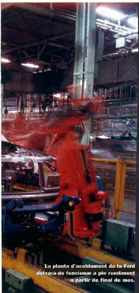
La planta d'acoblament de la Ford deixarà de funcionar a ple rendiment a partir de final de mes.

ment a Ford. El màxim representant de la UGT, Gonzalo Pino, justifica la decisió de l'empresa perquè "no hi ha prou càrrega de treball" i confia que al mes de gener, quan s'acabarà l'expedient de regulació temporal, "tot tornarà a la normalitat". Per això, els esforços de la UGT se centren a aconseguir que els afectats per la retallada cobren el 100% del sou, i no el 70% com proposa l'empresa.