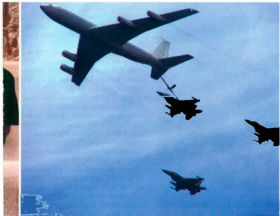
El president dels EUA, George Bush, i el primer ministre israelià, Ehud Olmert. A la dreta, caçabombarders F16 israelians que el 1981 van bombardejar un reactor nuclear a l'Iraq.

brutals els atemptats suïcides dels islamistes, mai no han amenaçat greument l'existència mateixa de l'estat jueu.