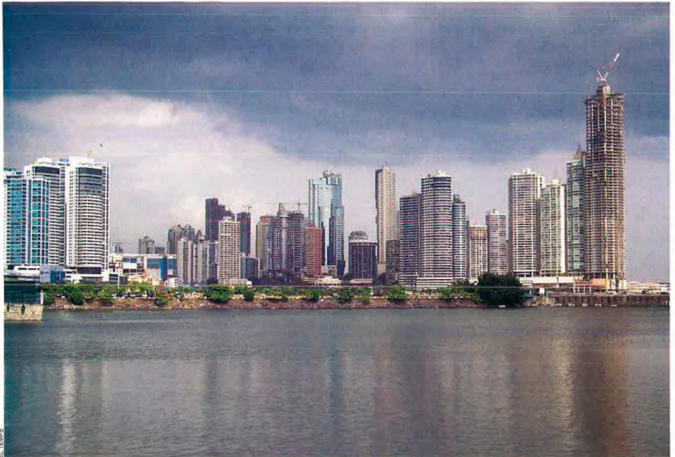
L'estat espanyol és el segon inversor mundial de Panamà, paradís fiscal predilecte de la majoria de grans empreses espanyoles.