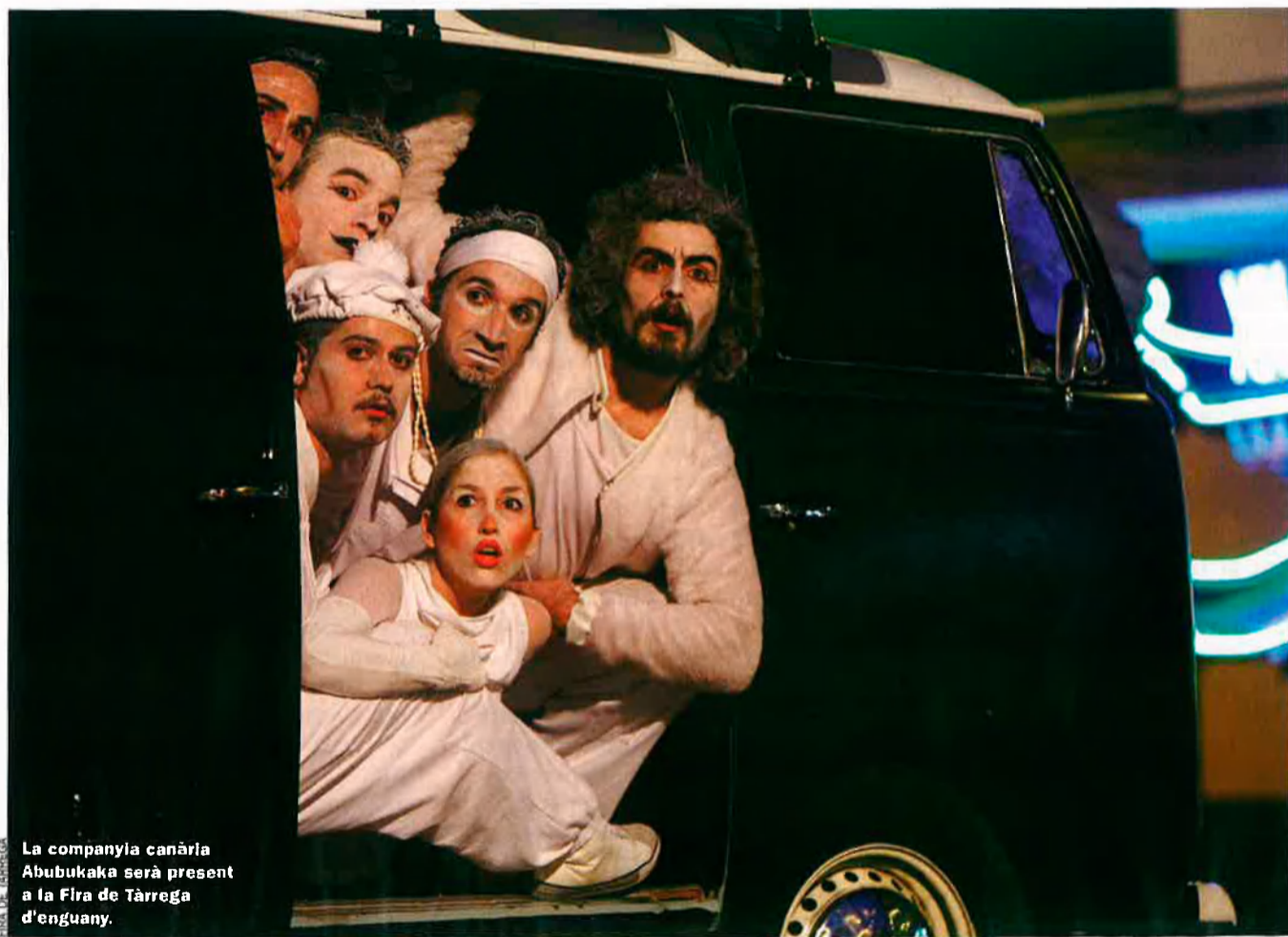
La companyia canària Abubukaka serà present a la Fira de Tàrraga d'enguany.

La fira començarà a mig matí de dijous, dia 11, però no podrà dir-se que ha començat del tot fins després de l'acte inaugural. Una altra aposta per les creacions catalanes arriscades que aprofiten el carrer per oferir obres de gran format. Enguany s'ha encarregat a la companyia Efímer. Han promès un muntatge –titulat Pop3 – molt vistós, amb referències a l'art de la societat de consum, el pop-art d'Andy Warhol. Tot plegat, a partir de colors vius, el joc pirotècnic, la videoprojecció, grans estructures en moviment i una banda sonora del compositor Rafel Plana. Amb això volen cridar l'atenció del públic. De fet, el grup Efímer ja ho va fer el 30 de novembre, de cridar l'atenció del públic d'aquestes terres. En aquella ocasió, que hom