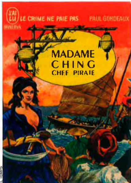
El poder de la flota de la pirata Ching Shih superava fins i tot el de la de l'Imperi xinès.

Read emmalaltí i morí a la presó. Sembla que algú va intercedir per Anne Bonny i hom li concedí la llibertat. Mai no se'n tornà a tenir notícia.