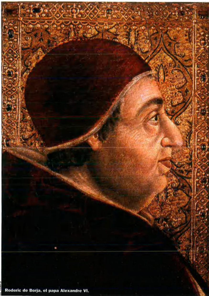
Roderic de Borja, el papa Alexandre VI.

drap d'aur ab moltes perles", assistit pel seu joglar: "Tot aital ordre tenc a totes les altres viandes que s'hi donaren a menjar; que en cascu menjar que aportà deia una dansa novella que ell havia feta, e hi donà vestits, a cascuna viande, molt ric e honrats, e donaren-s'hi ben deu viandes." A continuació, els nobles i cavallers i més servidors serveixen la resta dels convidats molt "complidament".