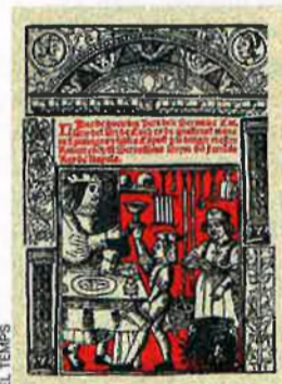
El Llibre del coc fou el primer llibre imprès de cuina.

Projecció internacional. Si Mestre Robert fa una projecció internacional de la cuina catalana, això només és possible