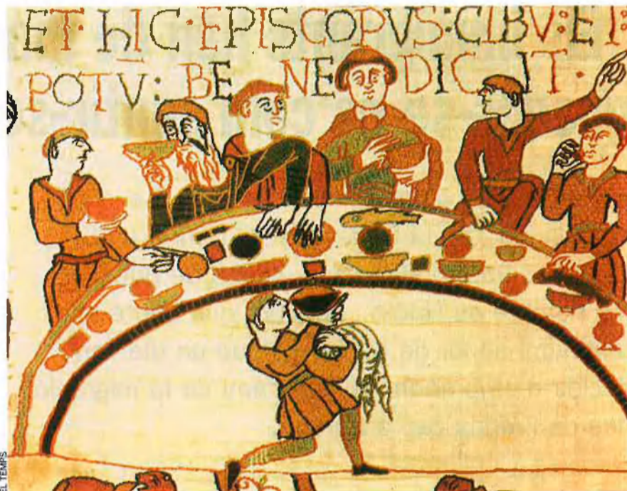
El banquet de Guillem el Conqueridor. Detall de l'anomenat Tapis de Bayeux, brodat segurament a final del segle XI i que representa diverses escenes de la conquesta normanda d'Anglaterra.

Banquets dels Borja. Tenim magnífiques descripcions de grans àpats rituals, alguns a l'aire lliure, el Dietari del capellà d'Alfons el Magnànim amb convits celebrats a Nàpols que enlluernaven la noblesa italiana, a la Crònica de Pere III, a la de Ramon Muntaner i en diversos documents valencians, incloent-hi els convits borgjans celebrats a València, la més refinada capital catalana del segle XV, o els que tingueren lloc a Roma, descrits amb tot detall per Johannes Burckard, el mestre de cerimònies del papa Alexandre VI. S'en destaca el banquet ofert per Roderic de Borja al bisbe de Sigüenza don Pedro González de Mendoza el 25 d'octubre del 1472 al palau episcopal: el bisbe castellà, procedent de l'austera