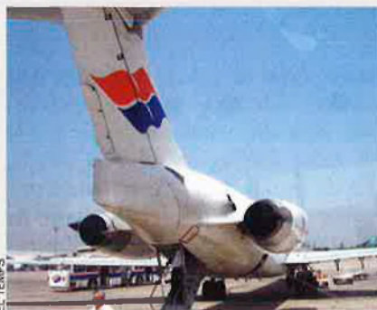
L'aeroport de Manises.

El president de la Generalitat Valenciana, Francesc Camps, va proposar la setmana passada d'aplicar als aeroports el mateix sistema de gestió que actualment regeix l'activitat portuària, cosa que podria permetre que l'administració autonòmica en designara el seu president i un tercer dels membres del consell d'administració. La resta de nomenaments restaria a les mans de l'administració central, empresaris, associacions patronals i sindicals vinculades al port i a l'ajuntament. Segons Camps, la Generalitat pretén que “els aeroports funcionen tan bé com els ports”. La Cambra de