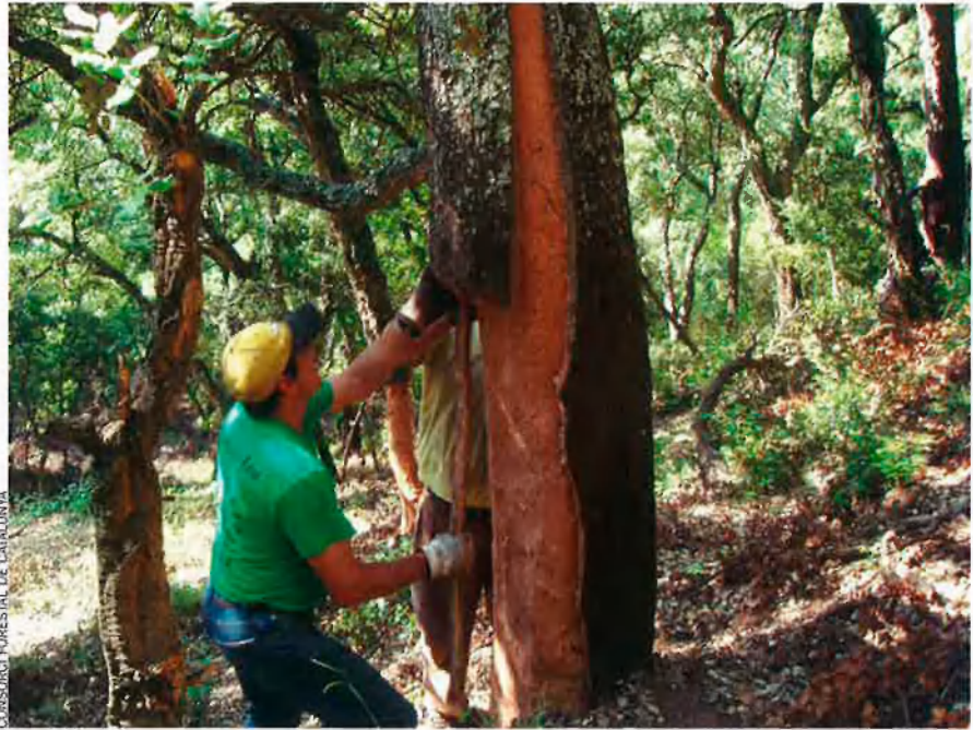
CONSORCI FORESTAL DE CATALUNYA

Crisi identitària. La qualitat del suro extret i transformat principalment a les comarques gironines és garantia de qualitat per al mercat exterior. Així i tot, la qualitat del suro català s'ha enfrontat darrerament a una forta crisi identitària. Dels anys 90 ençà, l'augment de producció –arran de l'increment de consum del vi embotellat–, juntament amb el