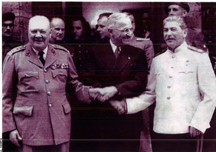
Els presidents dels EUA i de l'URSS, Truman i Stalin, aliats a Potsdam, el juliol de 1945, amb el primer ministre britànic, Winston Churchill.

dent dels EUA Harry S. Truman no es decidí a contraatacar. El 12 de març de 1947, el demòcrata va fer un gran discurs davant d'un Congrés entusiasmats, esbossant allò que passaria als annals de la història com la doctrina Truman . Els Estats Units ajudarien tots aquells pobles "la llibertat dels quals es trobava amenaçada per minories militants o per pressions exteriors".