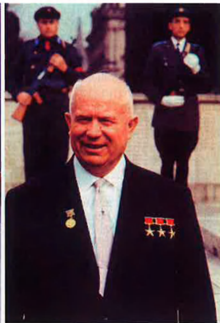
Kennedy (1963) i Khruixtxov (1964) van viure els moments més tensos de la guerra freda.

ser ell, sinó el seu ministre d'Afers Estrangers, Henry Kissinger, qui donà l'alarma a les forces armades dels EUA arreu del món. Kissinger volia assenyalar així als russos que no havien d'atacar el Sinai.