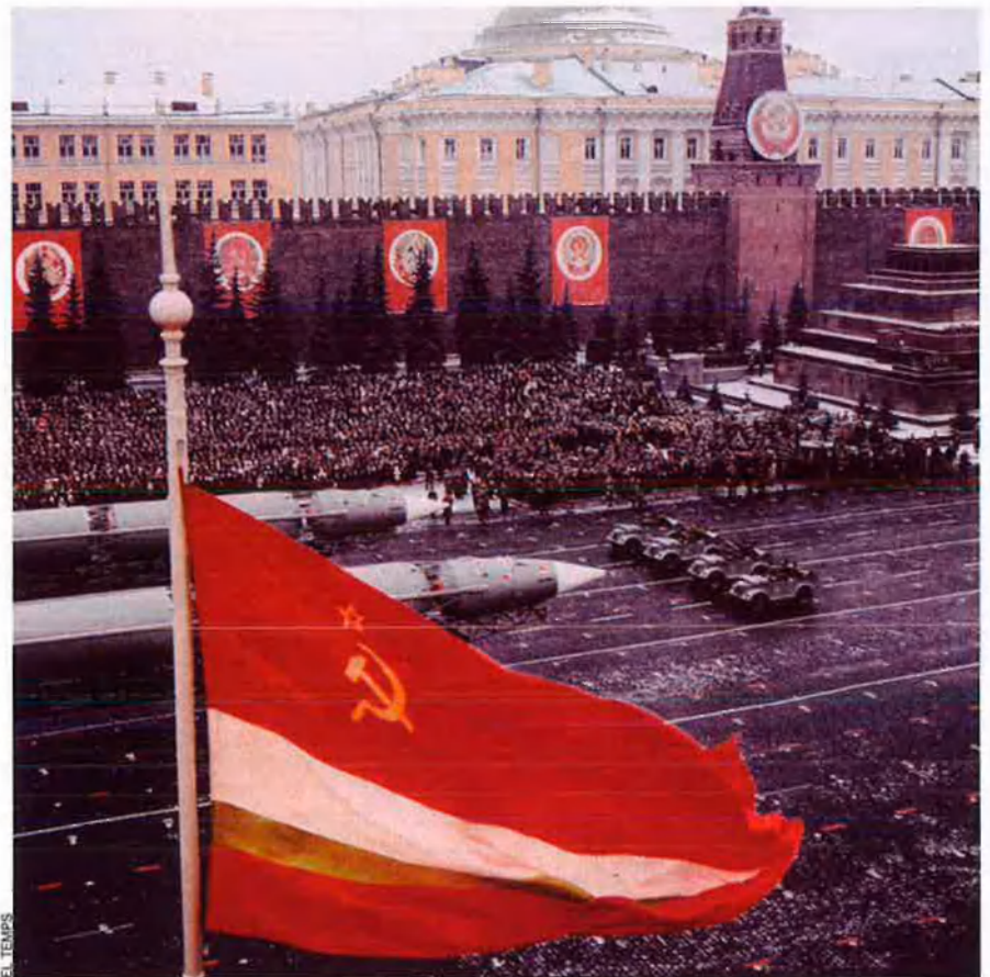
Desfilada militar a Moscou (1970): l’equilibri del terror restablert.

El pilot s’orientava, sobretot, pels estels. Els seus companys en terra li indicaven la ruta de navegació només a estones. De sobte, després de vuit hores en l’aire, el pilot va sintonitzar una altra veu desconeguda; també aquesta li do-