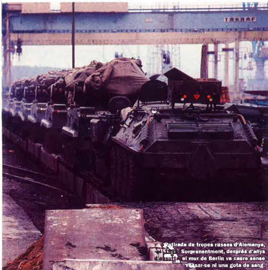
Retirada de tropes russes d'Alemanya, el 1994. Sorprenentment, després d'anys el mur de Berlín va caure sense vessar-se ni una gota de sang.

Pacte de Varsòvia, l'organització antagònica de l'OTAN, que al principi només fou pensada com a mesura negociadora: el lideratge soviètic bé havia d'oferir alguna cosa a occident en canvi de la dissolució de l'OTAN.