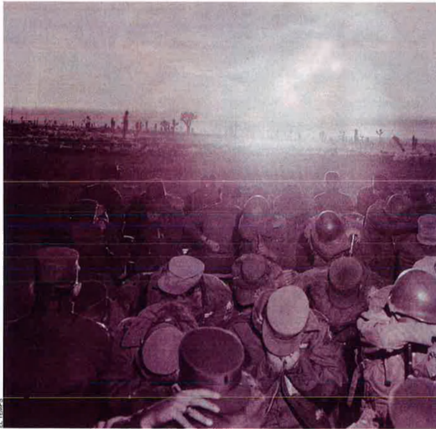
Assaig atòmic nord-americà al desert de Nevada, el 1957.

El 23 de juny del 1948, exactament a les 22.09 hores, el primer avió del pont aeri humanitari aterrava a l'aeroport de Tempelhof, al sud d'un Berlín d'estructura impossible. La ciutat era dividida en quatre sectors aliats i es trobava enmig de la part de l'antiga Alemanya dominada pels soviètics. Conseqüentment, els russos també detenien la sobirania de les artèries que anaven a la part occidental. Una posició ideal. Els soviètics volien aprofitar-la per expulsar els americans, els britànics i els francesos de Berlín i evitar així la creació d'un estat occidental, que s'anomenaria República Federal d'Alemanya.