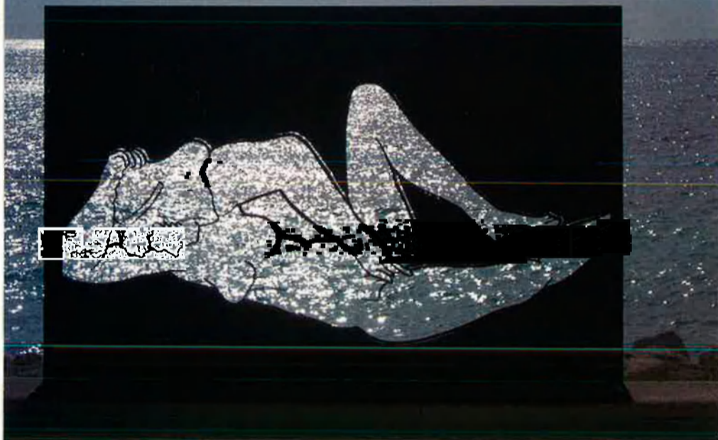
Escultura d'Antoni Miró instal·lada al passeig de la Marina de Xàbia.

Xàbia, a la Marina Alta, acull una gran exposició de l'artista alcoià Antoni Miró en què es repassa la producció dels darrers anys. La instal·lació d'escultures de temàtica eròtica alça polseguera.