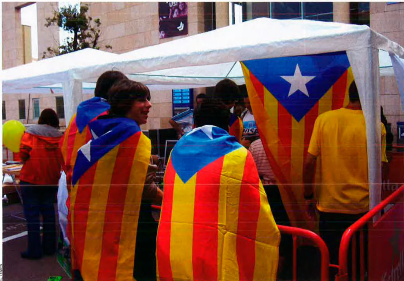
Els qui lluiten per una selecció nacional de futbol ja poden trobar-la a internet. De moment, només inclou jugadors del Principat.

de mercat del joc perquè el que volen és, òbviament, vendre. Nosaltres els hem proposat que incloguen la selecció catalana de fabrica, però prefereixen que continuem fent-ho nosaltres. Saben que aquesta selecció té un mercat molt reduït, Catalunya i, a tot estirar, l'estat espanyol; i, és clar, no els compensa.”